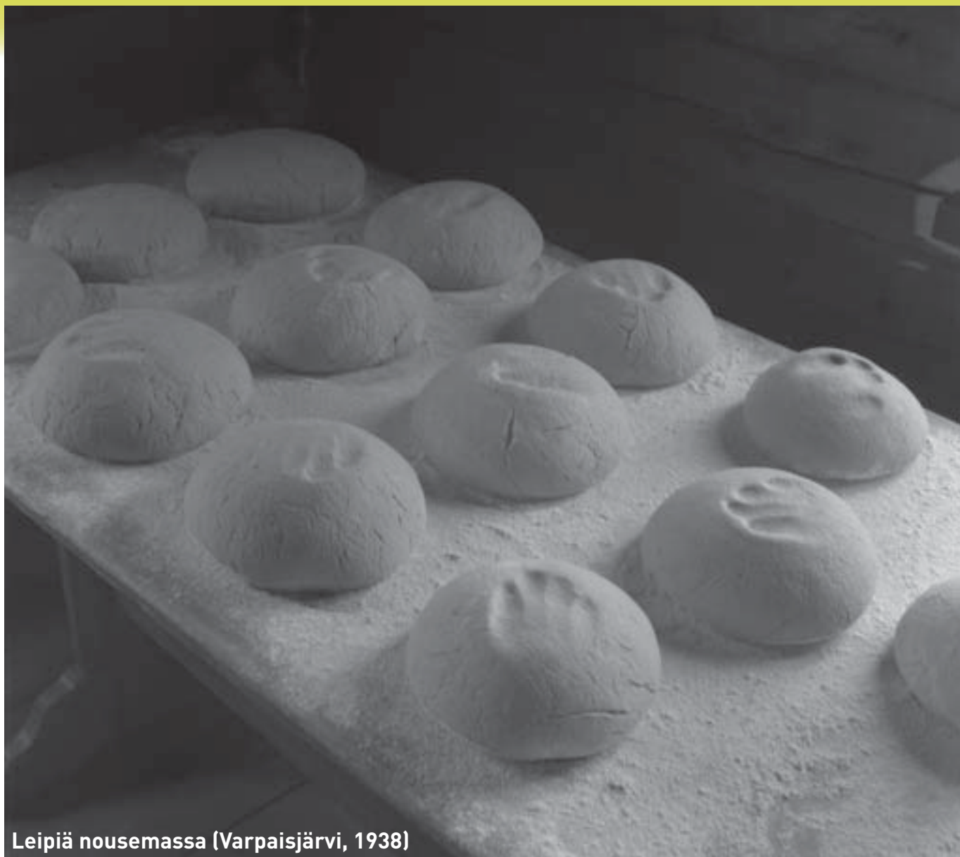
Leipiä nousemassa (Varpaisjärvi, 1938)