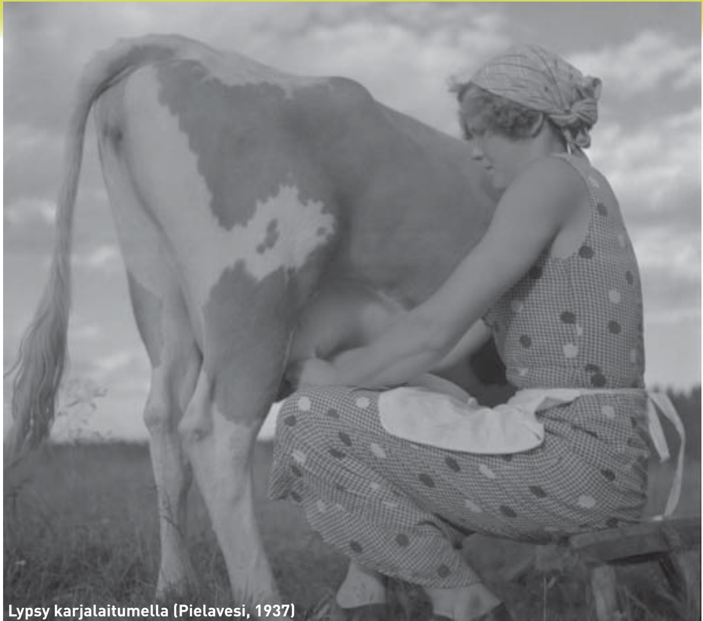
Lypsy karjalaitumella (Pielavesi, 1937)