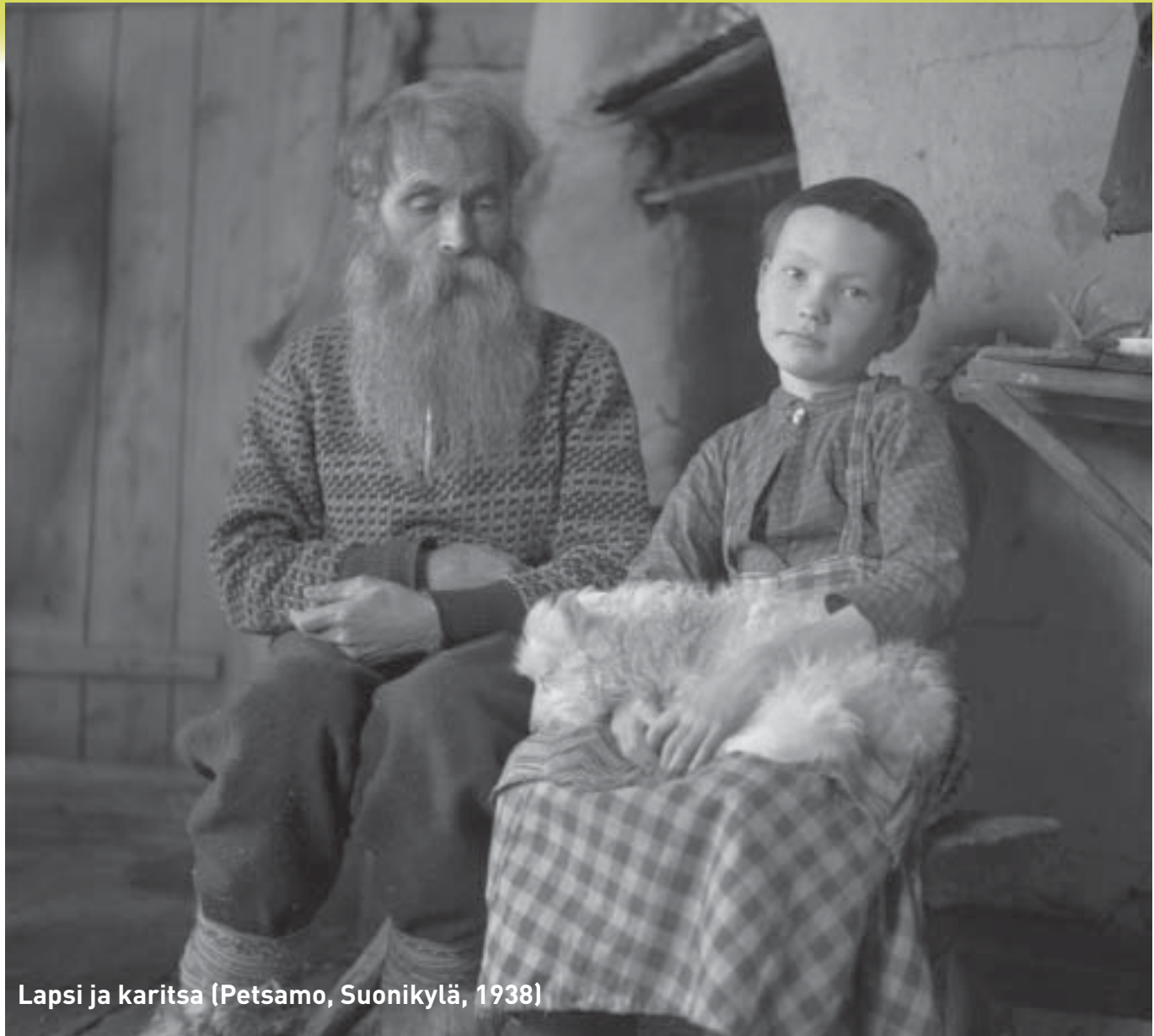
Lapsi ja karitsa (Petsamo, Suonikylä, 1938)