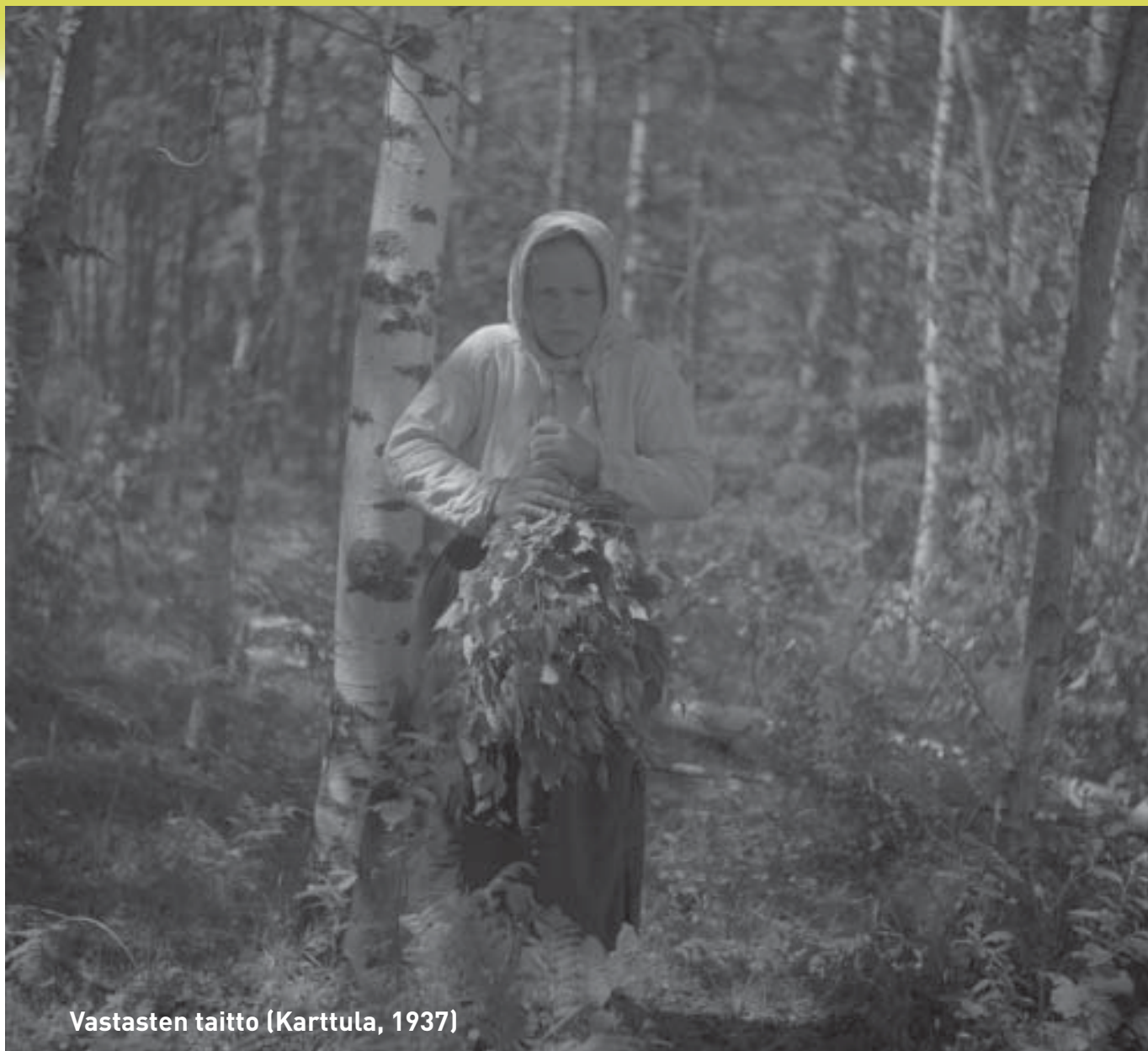
Vastasten taitto (Karttula, 1937)