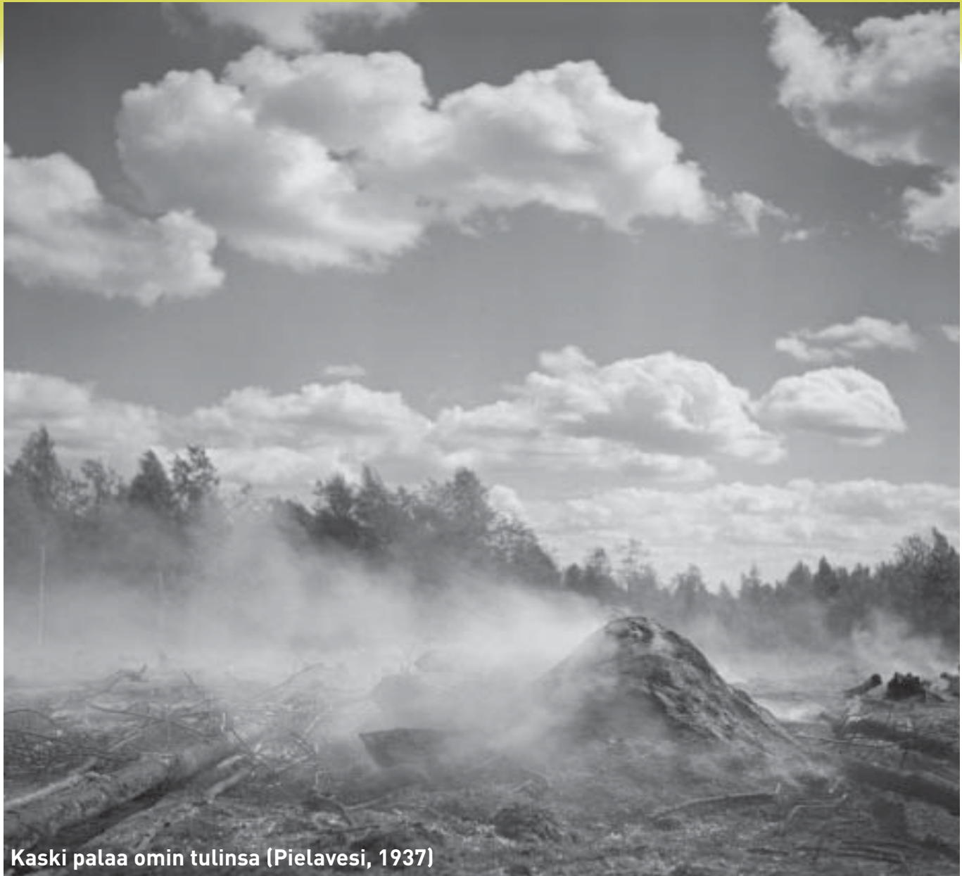
Kaski palaa omin tulinsa (Pielavesi, 1937)