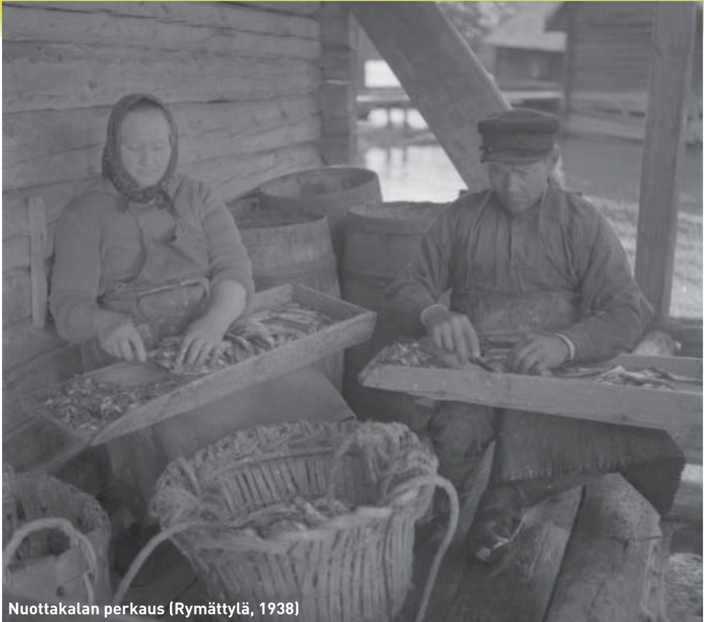
Nuottakalan perkaus (Rymättylä, 1938)