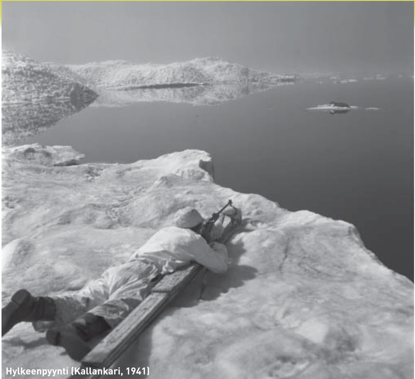
Hylkeenpyynti (Kallankari, 1941)